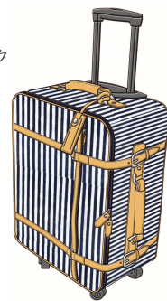
手刷りストライプのコロコロ