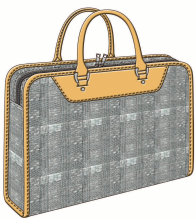
手刷りグレンチェックの本気カバン