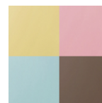
カラーバリエーション