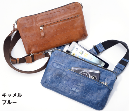
写真上：キャメル 下：ブルー