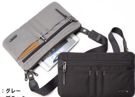
写真上：グレー 下：ブラック