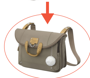
※ショルダーバッグ時