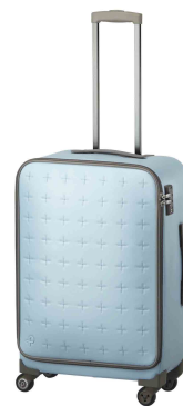
360 SOFT (サンロクマル ソフト)