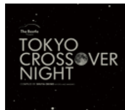
V.A. TOKYO CROSSOVER NIGHT