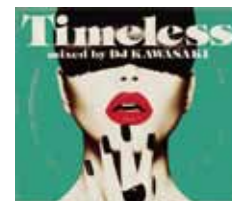
DJ KAWASAKI TIMELESS - mixed by DJ KAWASAKI