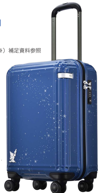
画像：小 06101 ネイビー © Disney