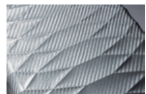
※スーツケースボディ表面(グレー色)