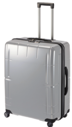
(98ℓサイズ、ダークシルバー)