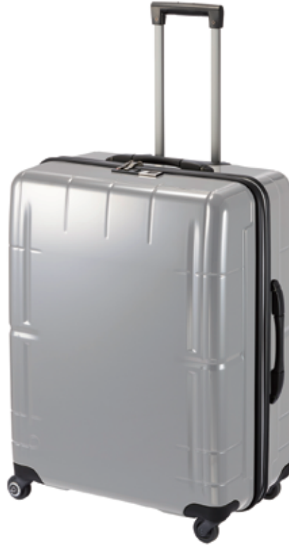
98ℓサイズ、ダークシルバークラッシュ

国内旅行でも使いやすい機内持込サイズから98ℓの大容量サイズまで、旅のスタイルに合わせて選べる3サイズ展開です。