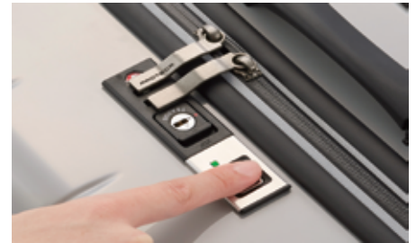
指紋認証ロック機構

「旅行中にスーツケースの鍵を紛失してしまった、設定したダイヤルロックの番号を忘れてしまった」という旅行中のトラブルを防ぐため、セキュリティ性の高い生体認証の〈指紋認証ロック機構〉をスーツケースに初搭載しました。セキュリティ性を高め、尚且つ旅を更にスムーズで快適にする新機能です。