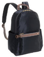
NO.57906 リュック ¥7,300 (W28×H40×D13cm)