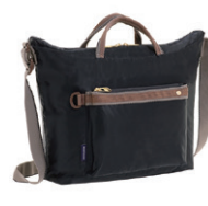
NO.57904 よこ型ショルダー ¥5,300 (W38×H24×D12cm)