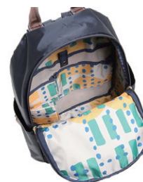
(リゾナーレ オリジナル内装プリント)

本体はシンプルなデザインやカラーリングで、内装には本企画のためにデザインされた、リゾナーレオリジナルのプリントを採用。自然をイメージした遊び心いっぱいの内装プリントは、旅のワクワク感を演出します。