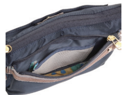
(メッシュポケット)