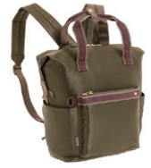
NO.57905 リュック ¥6,900 (W27×H34×D12cm)