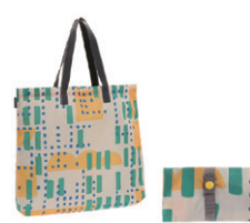
NO.57916 エコバッグ ¥1,280 (W44×H39×D6cm)