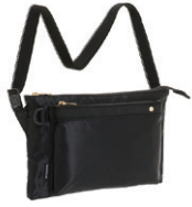
NO.57902 サコッシュ ¥3,900 (W28×H19×D2cm)