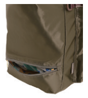
(シューズ専用ポケット)