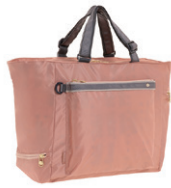
NO.57907 トート ¥7,900 (W49×H32×D19cm)