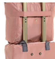
(セットアップ機能)

荷物出し入れに便利な前ポケットと背面ポケットや、キャリーケースのハンドルバーに固定して持ち運べるセットアップ機能など、快適な移動をサポートします。(セットアップ機能搭載: NO.57904～57907)