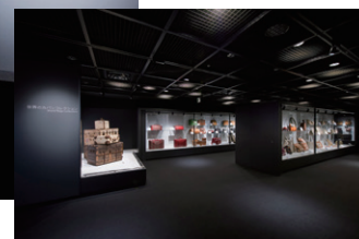
世界のカバン博物館（内観）

「世界のカバン博物館」は、エースの創業者・新川柳作がカバンを天職として生業を営ませて頂いた感謝の気持ちと社会の恩恵に対し、何かお返しができないものかという思いから、1975年に開館致しました。2010年には創業70周年記念事業の一環としてリニューアルを実施。このリニューアルに伴い、現在では世界約50カ国から集めた550点余りの珍しいカバンや、著名人から寄贈頂いたカバンを収蔵・展示しています。