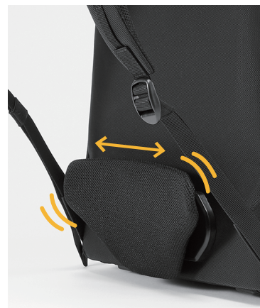
ランバームービングシステム™