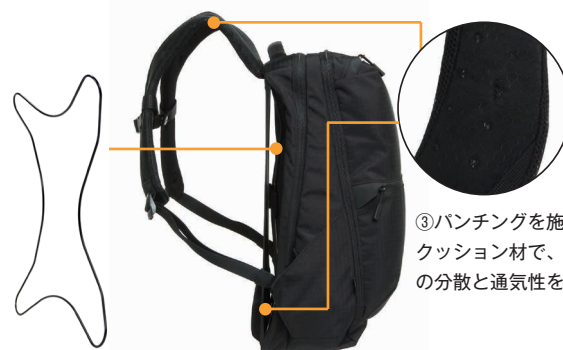
②ピアノ線を用いた枠構造で内装スペースを確保