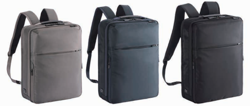
68004 (チャコール)、68005 (ネイビー)、68003 (ブラック)

リュック中(細) / 68005 / 28×39×12 / 14L / 870g / 25,300円