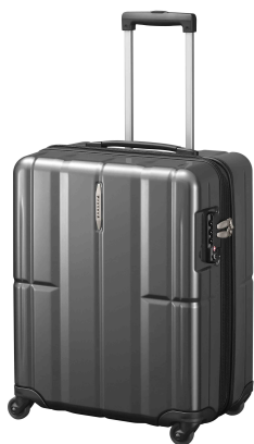
プロテカ「マックスパスH」 ガンメタリック