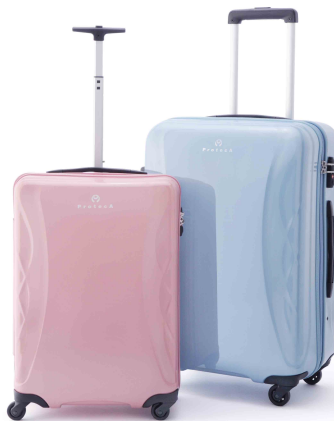
プロテカ「ラグーナライト」 オーシャンローズ(左)、フロートブルー(右)