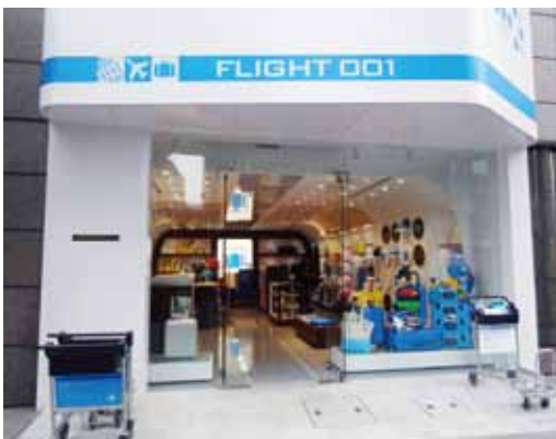
FLIGHT 001 原宿店外観

店舗はジェット機の機内を思わせるデザイン。ユニークかつオリジナリティにあふれる機能的なアイテムに加え、こうした店舗デザインも「FLIGHT 001」を特別な存在にしています。