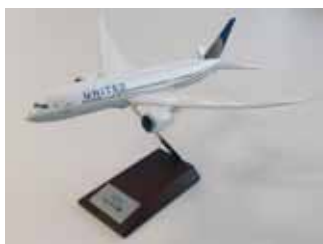
エアプレーンモデル（模型） 《イメージ》

税込 5,400 円以上お買い上げのお客様には、ユナイテッド航空オリジナルノベルティ他を進呈します。