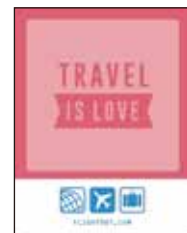
※1 回目キャンペーン時のステッカーデザイン

キャンペーン応募期間にあわせて、 SHOP ではステッカーを配布します！ 毎回デザインが異なるので、お楽しみに！ (数に限りがございます。)