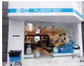
FLIGHT 001 原宿店外観