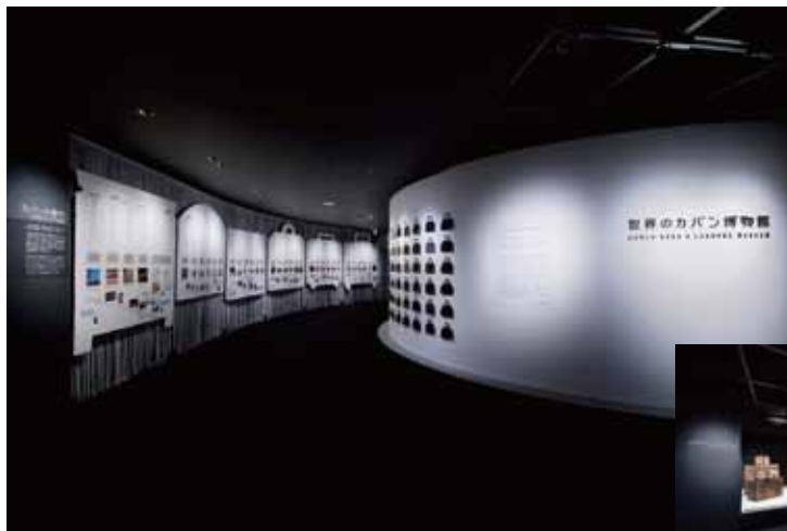
世界のカバン博物館（内観）