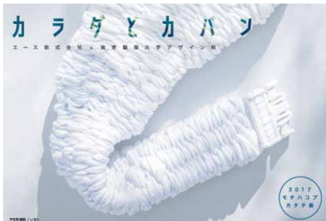
※2017 モチハコブカタチ展 告知 DM データ