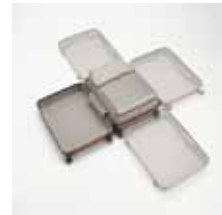
※4方向への開閉イメージ

タテにもヨコにも開けられる新発想のスーツケースです。空港や移動中にちょっと荷物を出し入れしたい時や、せまい室内での開閉など、シーンに合わせて開く方向を変えることができます。