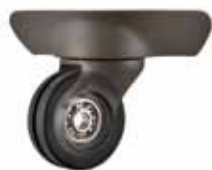
ベアリング搭載ホイール部 イメージ

摩擦抵抗を極限まで抑え、キャスターの回転を補助する高耐久性クロム鋼ベアリングをホイール部に搭載。