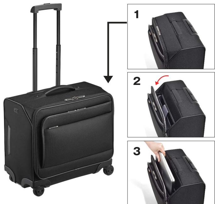
画像：横型トローリー