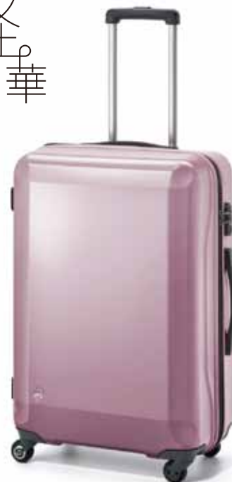
※画像サイズ…67Lピンク

【ブランド名】プロテカ 日本製 【シリーズ名】ラゲーナライト Fs 【価格】 ¥53,000～¥67,000（税別） 【型数】 4型（35L/47L/67L/82L） 【カラー】 4色展開（グレー/ピンク/ピーコックブルー/バイオレット）