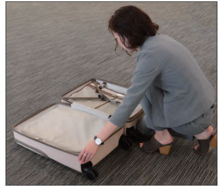
△スーツケースを床に寝かせて開けるのは大変

女性就業者は2016年に2801万人となり、5年連続で増え続けています。（※1）また企業のグローバル化に伴い、出張する女性も今後益々増えることが予想されます。このような背景を踏まえ、出張の多い女性社員へのヒアリングや空港リサーチを行った結果、 女性は移動中に出し入れする荷物が多い ことがわかりました。機内で使うスキンケアグッズ、防寒用ストール、現地で履き替えるパンプスなどを取り出す際に、 スーツケースを床に寝かせて開けるのは時間も手間もかかります 。そこで、荷物の出し入れや移動をスムーズに行える機能を搭載した「ビジネス用スーツケース」を開発しました。