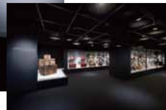
世界のカバン博物館（内観）

「世界のカバン博物館」は、エースの創業者・新川柳作がカバンを天職として生業を営ませて頂いた感謝の気持ちと社会の恩恵に対し、何かお返しができないものかという思いから、1975年に開館致しました。2010年には創業70周年記念事業の一環としてリニューアルを実施。このリニューアルに伴い、現在では世界約50カ国から集めた550点余りの珍しいカバンや、著名人から寄贈頂いたカバンを収蔵・展示しています。