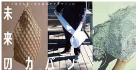
企画展 DM データ 表面 (左より作品①②③)