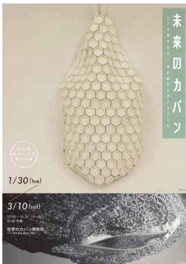
企画展ポスターデータ

「2018 モチハコブカタチ展」では、東京藝術大学美術学部デザイン科の1年生44名が「未来のカバン」をテーマに、未来の生活やライフスタイルをイメージした“モチハコブカタチ”をデザインし、その作品をエースが運営する世界のカバン博物館で特別展示する企画展です。