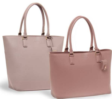
画像：（左）縦型／グレージュ、（右）横型／ダスティローズ