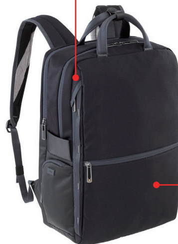
画像：リュック／ブラック ¥23,000（税抜き）