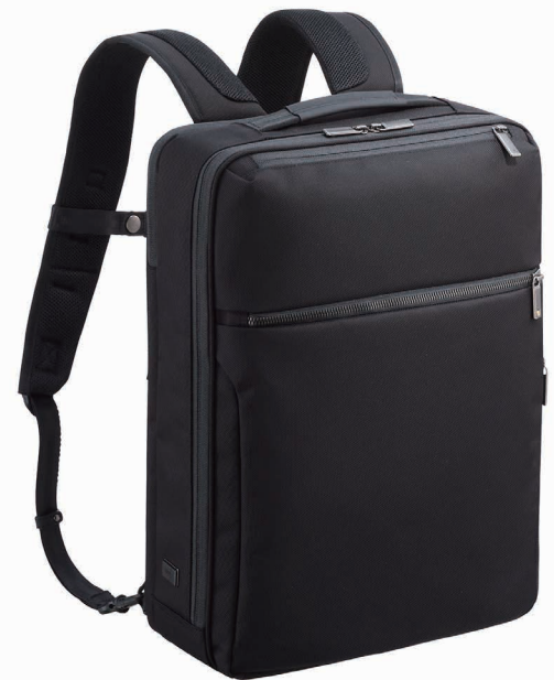
画像：ガジェットブル CB ¥22,000