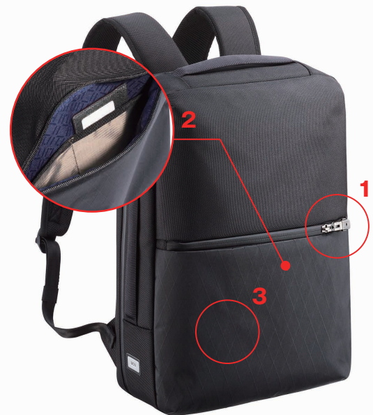
画像：リュック大（ブラック） ¥17,000

異なる特性を持つ4種類の素材を貼り合わせることで、織物の弱点である伸びや防水性、切り裂きへの強度を高めた特殊生地「X-PAC™」をフロントポケット部分に使用しました。