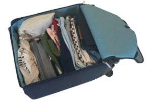
大容量荷物（衣類 30 枚）収納イメージ