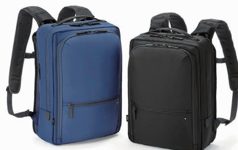
画像：67194（ネイビー）67191（ブラック）

67194 / リュック大（ズレ軽減） / 29×42×12 / 31,900円