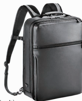
(67543 / ブラック)