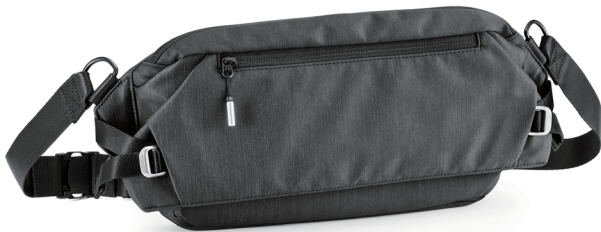
画像：クロスリング H・大・ブラック