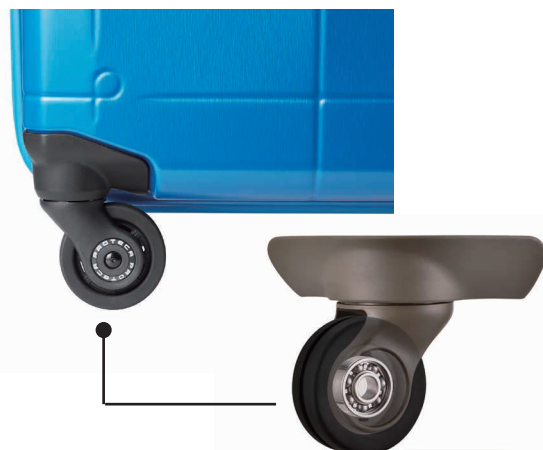
ベアロンホイール構造

また、高耐久性クロム鋼ベアリングを内蔵した「ベアロンホイール ® 」を採用することで、摩擦係数が約 60%軽減 (※1) 。軽い力で取り回しができ、滑らかな走行を実現します。