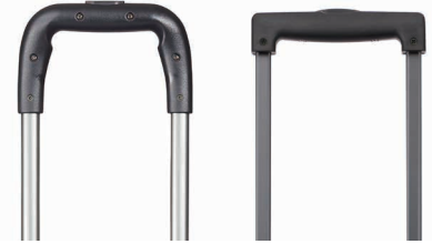
3way ハンドル / 一般的なハンドル

揺れる電車内やエスカレーターなどでの不意な走行を防ぐため、手元スイッチで簡単に車輪を固定できる独自開発・特許取得のキャストーストッパー機能「マジックストップ®」を搭載しています。