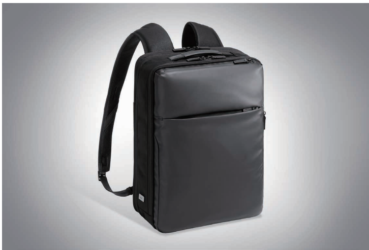
ガジェットブル DP2 4U