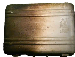
▲1974年 爆破された飛行機内から、中身は無傷のまま発見されたアタッシュケース

現在発売中のアルミラゲージ「ヘリテージライン」は、宇宙を旅したアルミケースと同様の素材を採用し、ブランドの原点に立ち返った、新たなコレクションです。全国の直営店、オンラインストアおよび主要百貨店・専門店にて展開しています。また、旗艦店「ゼロハリバートン 新宿サザンテラス店」では、1974年に爆破された飛行機内から、中身は無傷のまま発見されたアタッシュケースや、ゼブラ柄や木目柄の希少なアタッシュケースなど、歴史を物語るアーカイブ品を一部展示しています。歴史の現場をくぐり抜けた本物に触れながら、ゼロハリバートンが誇る堅牢性を体感いただけます。