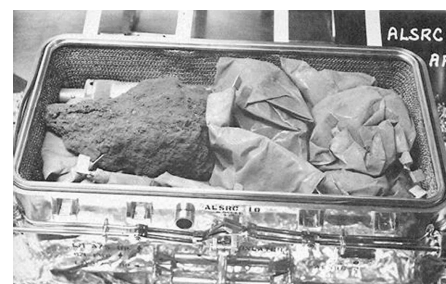
▲月の石を持ち帰った「月面採取格納器」